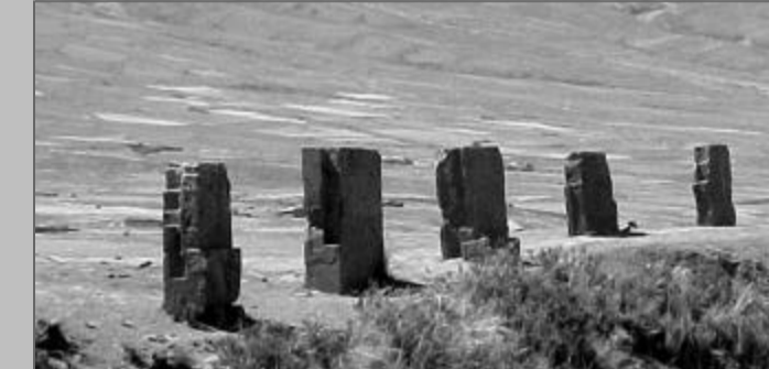
Columnas de piedra que se encuentran en la cima de la pirámide.

Además, está prevista la realización de excavaciones en el área comprendida entre las esquinas noreste y sureste, además en la cara este de la pirámide, enfatizando la zona que fue víctima de saqueos durante la colonia.