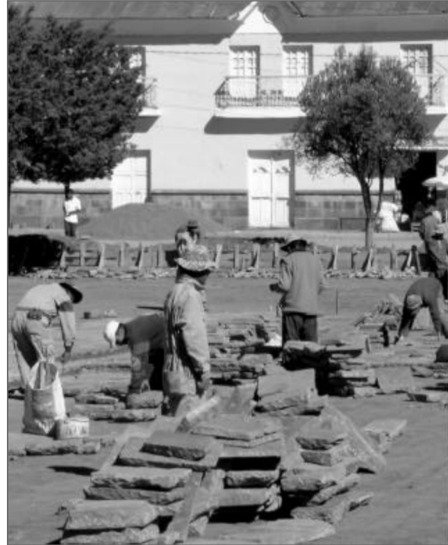
La plaza de Tiwanaku se hace más atractiva para los turistas

Las obras, que demandarán una inversión total de 102.973 dólares, son ejecutadas desde el 12 de abril y, según los cronogramas del proyecto "Cultura para el desarrollo", concluirán el 26 de septiembre de este año. Hasta el 21 de julio pasado, en la remodelación de la plaza se invirtieron 32.304 dólares y se generaron, en promedio, 30 empleos mensuales.