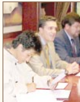
La firma del acuerdo de financiamiento

La participación de la población es fundamental para el éxito del proyecto "Cultura para el desarrollo" que tiene como beneficiarios a los mismos habitantes.