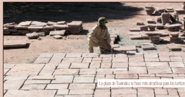
La plaza de Tiwanaku se hace más atractiva para los turistas

Los trabajos en la plaza comenzaron con el retiro de las losetas, el empedrado y