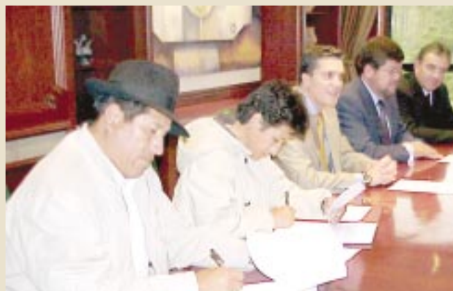
El acto de la firma del convenio de financiamiento

El proyecto consolidado permitirá a la población beneficiaria desarrollar su economía en base al turismo, creando nuevas fuentes de empleo e ingresos destinados a mejorar las