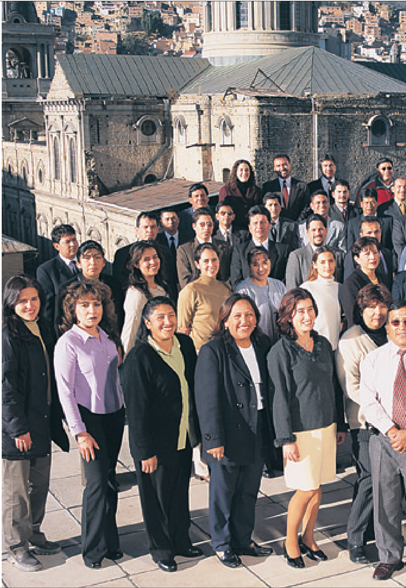
Personal de la oficina central de SOBOCE, La Paz - Bolivia