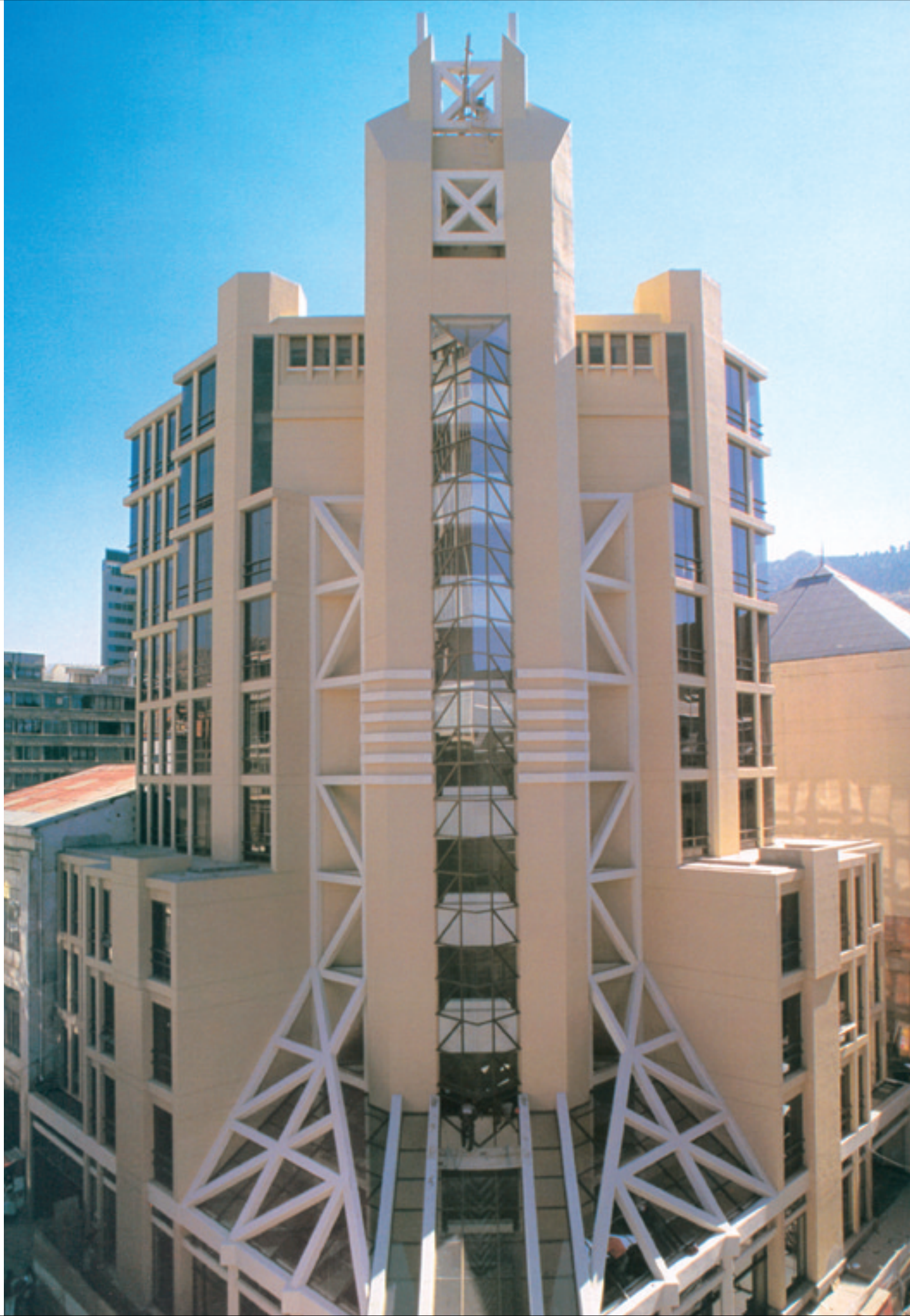
Edificio SOBOCE, La Paz - Bolivia