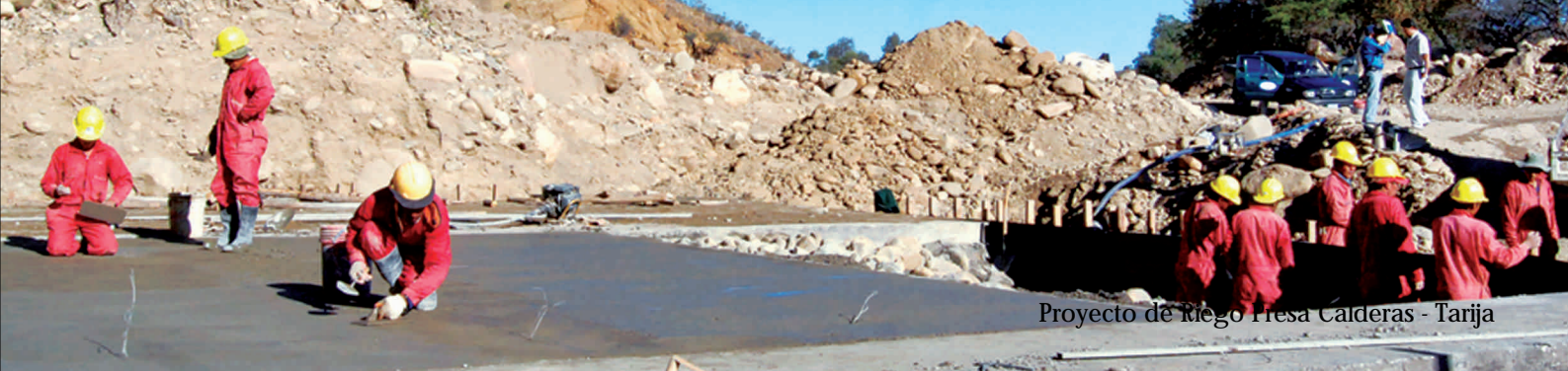
Proyecto de Riego Fresa Calderas - Tarija